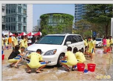
弘文中學學生假日上街參加公益洗車派對，用雙手回饋社會。

【記者蘇孟娟／台中報導】弘文中學兩百餘名學生，昨日上街「開派對」！學生不是放假作樂，而是響應公益洗車助聽損兒，用雙手回饋社會；雖然要在太陽下揮汗洗車，甚至雙手因泡在肥皂水而變皺，但學生們高喊很有意義，一點都不苦。