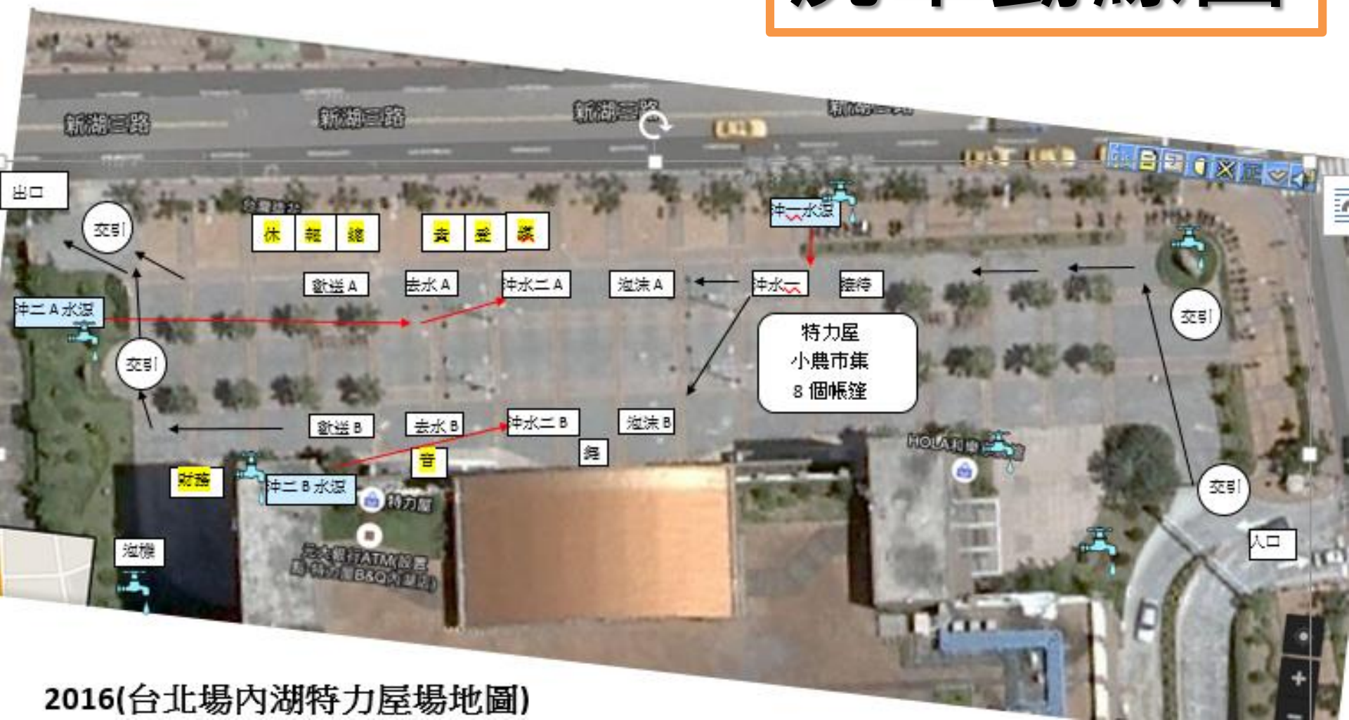
2016(台北場內湖特力屋場地圖)